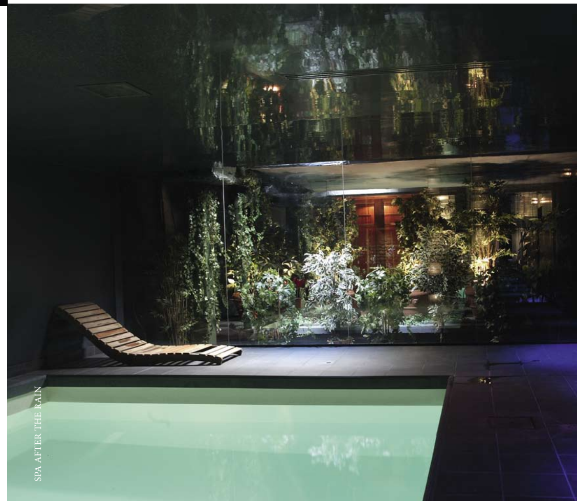
SPA AFTER THE RAIN

SPA AFTER THE RAIN HÔTEL SAINT JAMES & ALBANY 202 RUE DE RIVOLI / 75008 PARIS / +33 (0)1 44 58 43 77 AFTERTHERAIN.CH